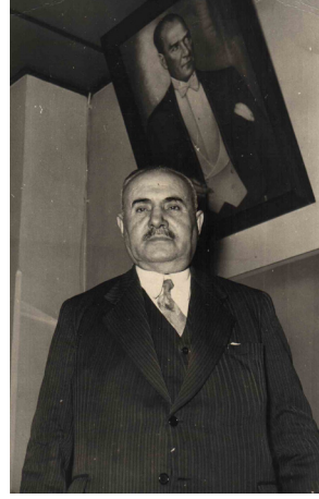
Nuri Demirağ ve kendisine soyadını veren Mustafa Kemal Atatürk'ün resmi.