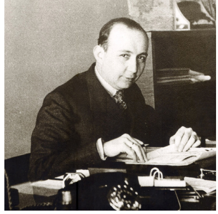
Vehbi Koç, Koç Ticaret'in ofisinde, 1938.