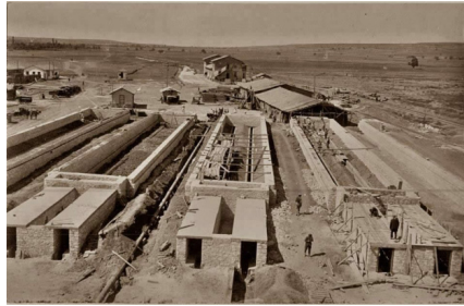
Uşak Şeker Fabrikası'nın inşaatından bir fotoğraf.